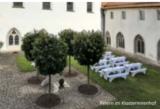
Feiern im Klosterinnenhof