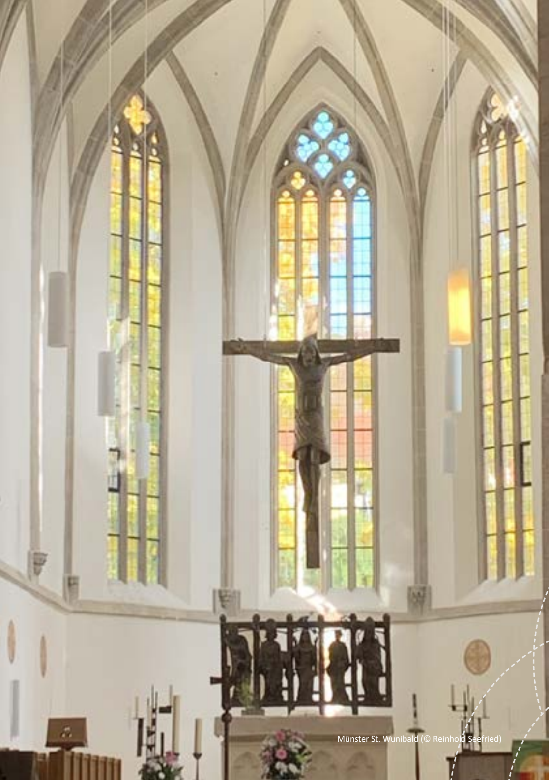
Münster St. Wunibald