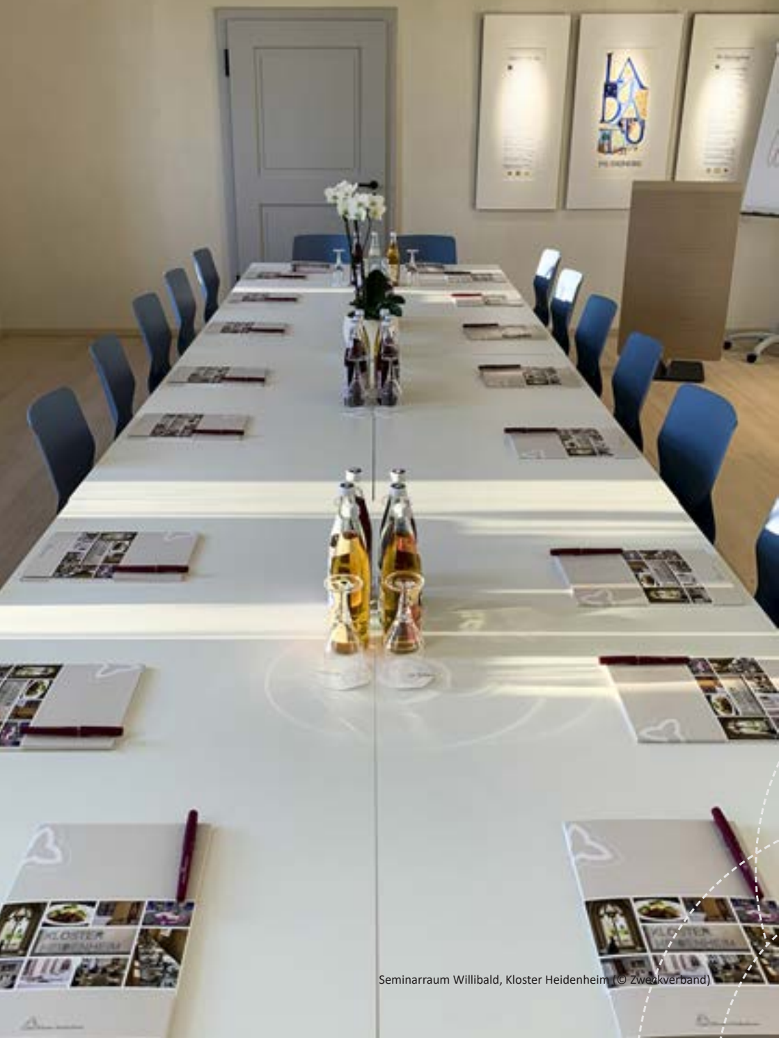
Seminarraum Willibald, Kloster Heidenheim