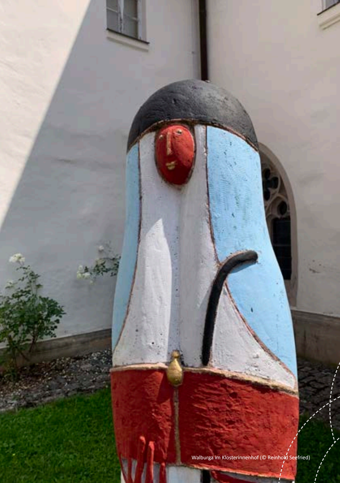
Walburga im Klosterinnenhof