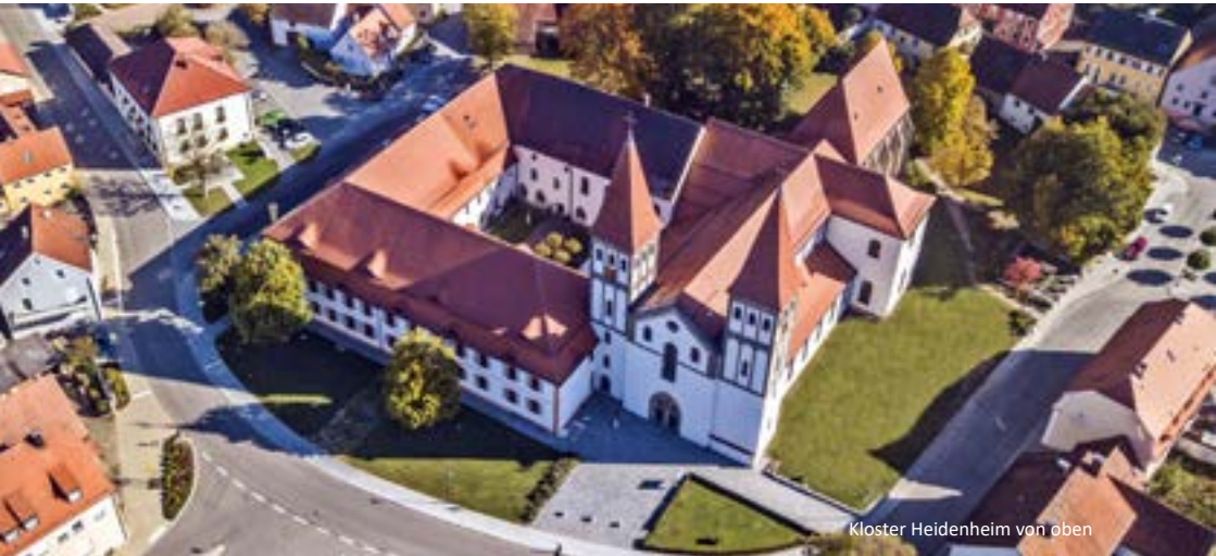
Kloster Heidenheim von oben